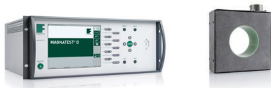
Abb. 1: MAGNATEST D und Prüfspule

Mit dem Prüfgerät MAGNATEST D von FOERSTER können die Einspritzsysteme nach dem Autofrettage-Prozess geprüft werden. So kann ermittelt werden, ob der Autofrettage-Prozess korrekt durchgeführt wurde.