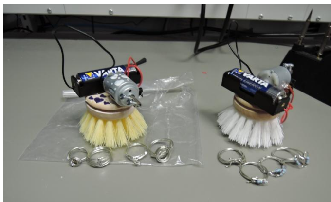
Abbildung 1: Die gefertigten Bürsten und Ringe.

Empfangen wurden die Schülerinnen von Ausbildungsleiter Siegfried Härter. Bevor die Mädchen selbst tätig werden durften, lernten sie in einer kurzen Unternehmenspräsentation das Unternehmen FOERSTER und dessen Produkte besser kennen. Nach einer Sicherheitseinweisung durften die Teilnehmerinnen dann ihr handwerkliches Geschick unter Beweis stellen. Zunächst wurde anhand einfacher Verbindungen das Löten geübt, bevor dann kleine Schmuckstücke gelötet wurden. Sichtlich stolz waren alle über ihre selbst angefertigten Ringe. Doch damit nicht genug bastelten die Mädchen anschließend eine sogenannte „Laufbürste Wirbelwind“. Damit die Bürste selbstständig herumwirbeln kann mussten die Akademie-Teilnehmerinnen den Stromkreis mittels der gelernten Löt-Techniken schließen.